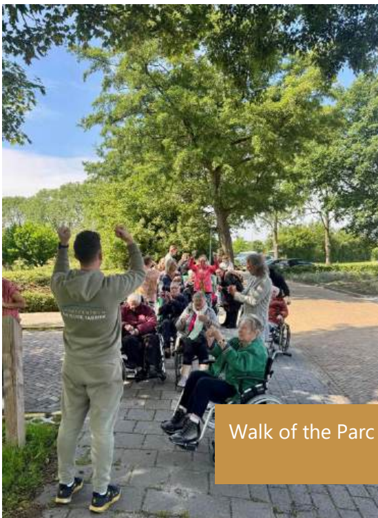
Walk of the Parc in de praktijk.

De sociale samenhang in Uithuizermeeden wordt over het algemeen positief beoordeeld. Bewoners staan in sterke mate voor elkaar klaar, waarbij het 'omzien naar elkaar' een belangrijk kenmerk van het dorpsleven vormt. Tegelijkertijd is er een zekere druk op deze sociale cohesie zichtbaar als gevolg van dorpsgroei en de instroom van buitenlandse arbeidskrachten. In verschillende buurten wordt het behoud van het 'plattelandsgevoel' en de informele onderlinge zorg expliciet als kernwaarde benoemd. Lokale initiatieven zoals DIP, Walk of the Parc, Mensenwerk en kerkelijke verbanden bieden belangrijke structuren waarin sociale verbinding en wederzijdse ondersteuning concreet vorm krijgt.