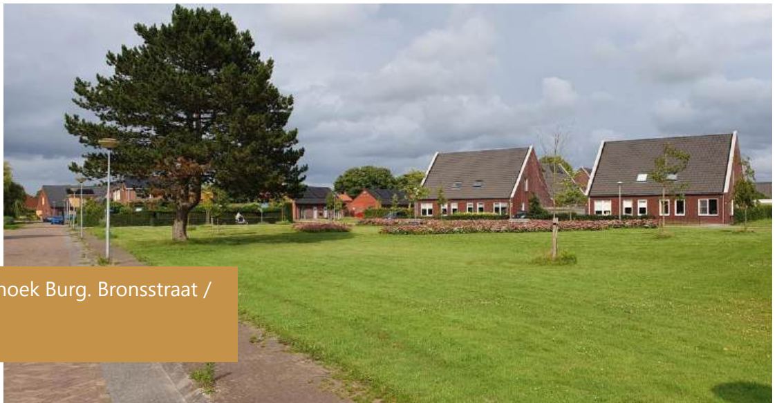
Speeltuintje op de hoek Burg. Bronsstraat / Pr. Beatrixstraat?