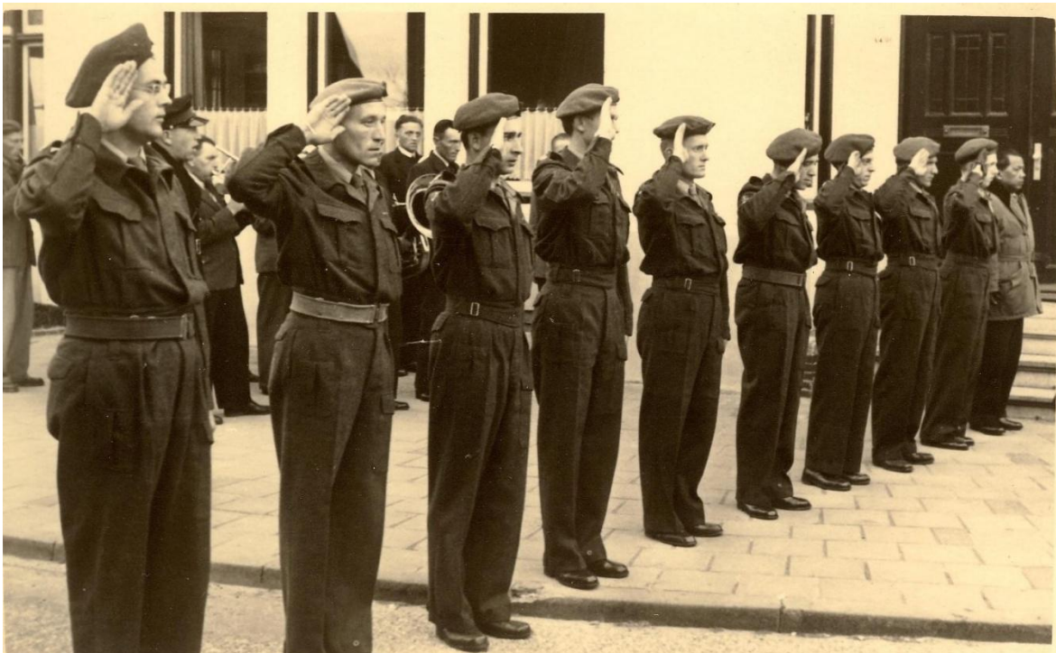
Herdenkingsamenkomst bij het voormalige gemeentehuis 1960