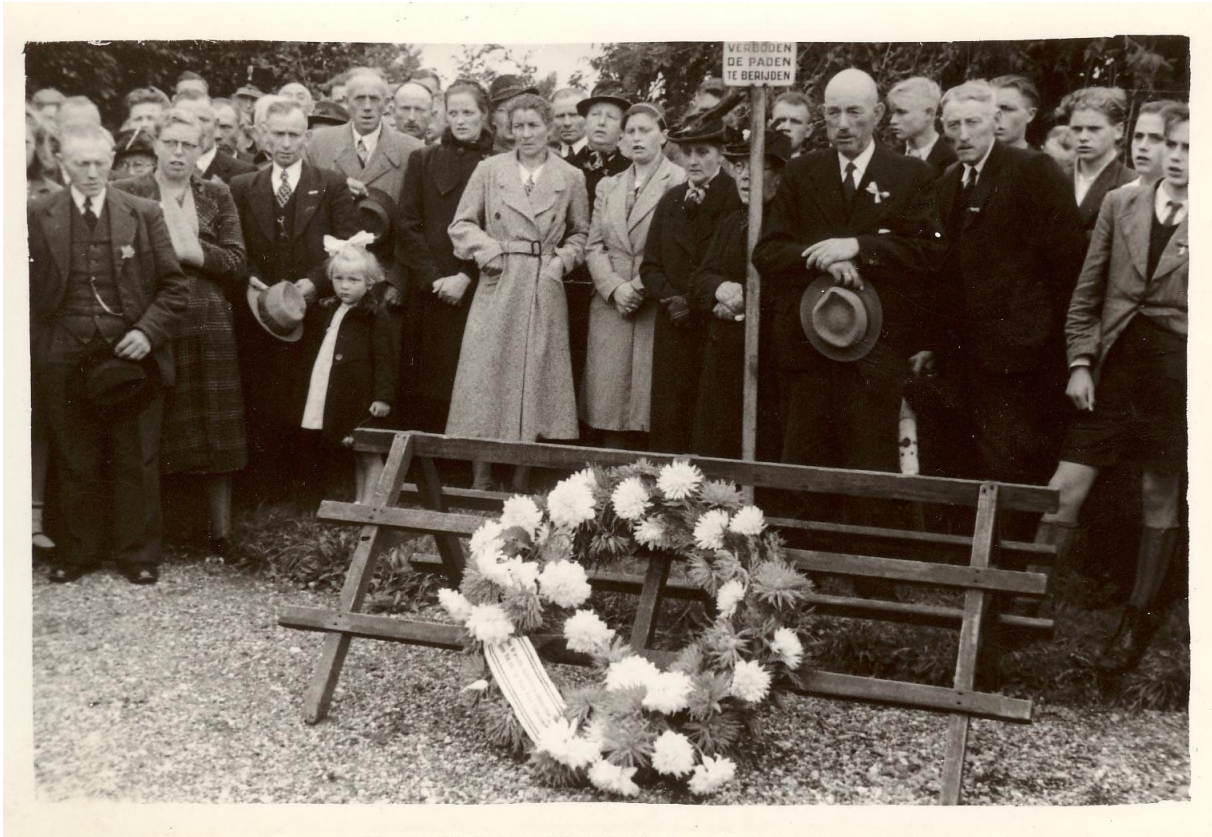
1ste herdenkingsamenkomst op 4 mei 1946